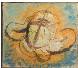
Jean Fautrier, Tête d'otage n°4 , 1944