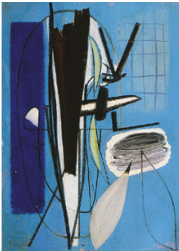
Hans Hartung, T 1945-18

↑ Cette composition dynamique est le témoin éloquent de l'état d'esprit du peintre au lendemain de la guerre, où il fut amputé d'une jambe. Dictée par la quête du « ton juste qui crée l'harmonie », son œuvre est marquée par son admiration pour la « clarté du cubisme » et son enfance passée auprès d'un grand-père musicien.