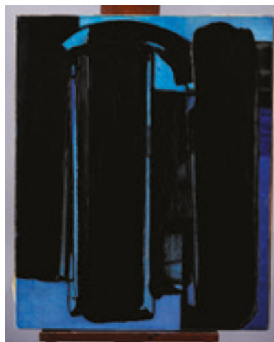
Pierre Soulages, Peinture 100 x 81 cm, 16 avril 1975

Loin des grandes capitales, c'est l'hôtel des ventes de Montpellier qui a proposé une toile de Pierre Soulages de 1975, le peintre de 101 ans résidant à seulement quelques kilomètres dans la ville de Sète. Cette « décentralisation » n'a pas empêché un beau résultat pour l'œuvre qui s'est vendue 1,3 M€ « prix marteau » soit 1,61 M€ frais compris. L'œuvre avait été acquise auprès du peintre et conservée par une collectionneuse montpelliéraine. Avec ses deux nuances de bleus qui soulignent subtilement la force du noir, elle entamera un voyage loin de sa région natale puisque c'est un acheteur belge qui a remporté les enchères le 8 mai dernier. Les œuvres de Soulages ont bénéficié dernièrement d'expositions importantes, notamment au Louvre pour les 100 ans de l'artiste, et plusieurs records en ventes aux enchères (prix public le plus élevé : 9,36 M€ frais compris).