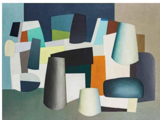
Abstraction , 1935, de Jean Hélion (1904 -1987). Huile sur toile. Signée, datée et annotée «B.78» au dos; signée sur la tranche 146 x 200 cm.